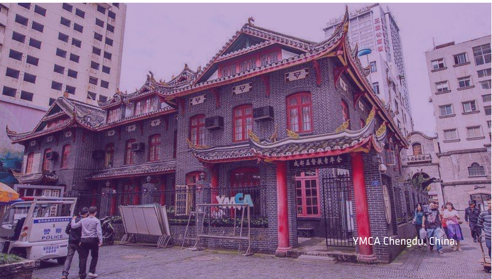
YMCA Chengdu, China.

Le mascherine sono state distribuite al nostro staff e, per quanto possibile, si è cercato di aiutare chi realmente ne aveva bisogno.